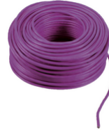
732I.C.100 - 2F+ cable 2x1 LSZH Cca 100m violeta