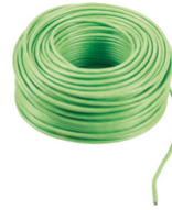
732I.E.100 - 2F+ cable LSZH 2x1 montaje ext. Eca 100m