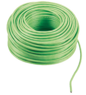
732I.E.500 - Cable 2F+ LSZH 2x1 montaje ext. 500m