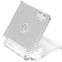
40596 - Base de mesa Tab 7 Up