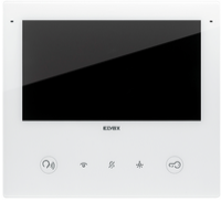
40517 - Videoportero 2F+ Wi-Fi Tab7SUp blanco