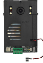
40135 - Unidad audio/vídeo 2F+