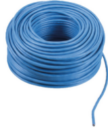
732H.E.500 - 2F+ cable PVC montaje int. Eca 500m