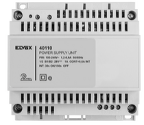
40110 - Alimentador 2F+ 100-240V 1 OUT 1,6A