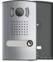
40151 - Placa audio/vídeo color 1 familia